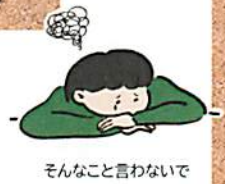
そんなこと言わないで

「もう少し頑張ってみようよ」 「どうして行けなくなっちゃったのかね」 「今日は保健室に入れたんだから、明日は教室に行ってみようね」 「今週は1日学校に行けたから、来週は3日行くようにがんばろうね」 「出席日数が少ないと高校入試に不利だから学校に行きなさい」